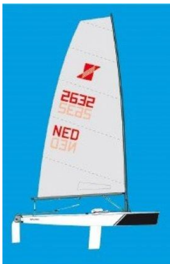
SPLASH RED 7.2 m² new Flash Class

Op de website vind je vanzelfsprekend ook onze jaarkalender. Je kunt hem zelf uitprinten en ophangen. Vanzelfsprekend hangen wij de kalender op in de Ark en in de vitrine kasten.