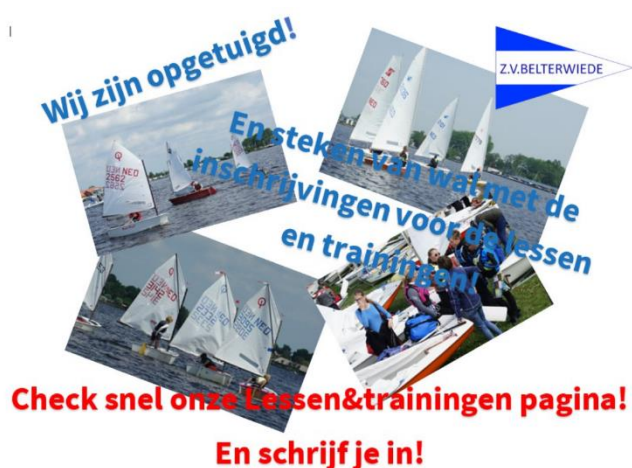
Screenshot webpagina ZVB

De ZVB is ook al "opgetuigd". Op de website tref je de activiteitenkalender 2024 aan. Je kunt precies nakijken, welke data je alvast in je agenda moet reserveren.